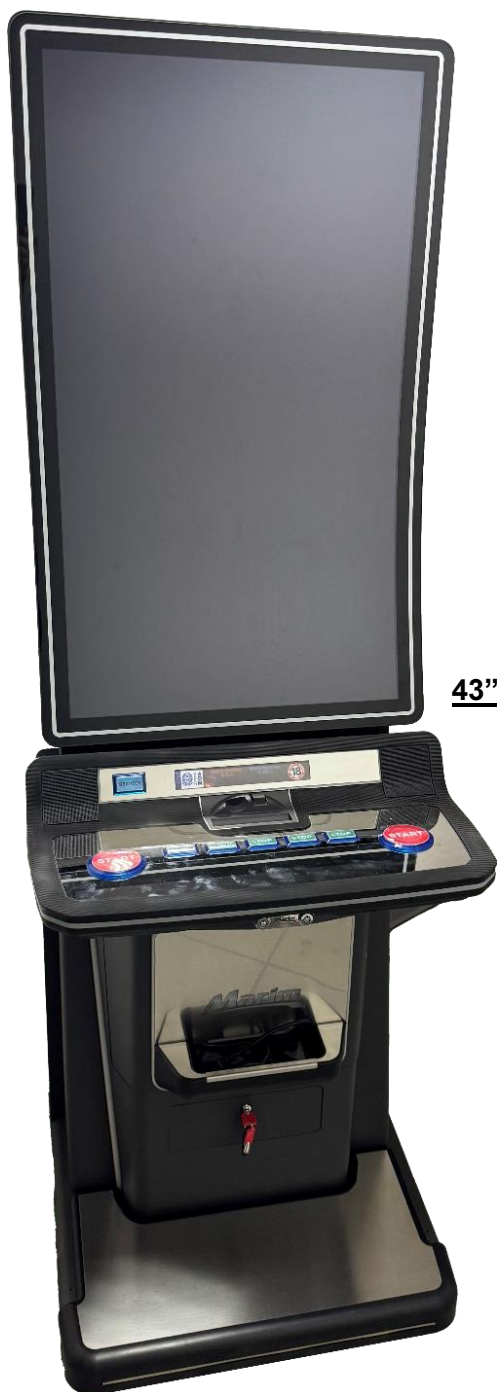
43" Touch 16:9